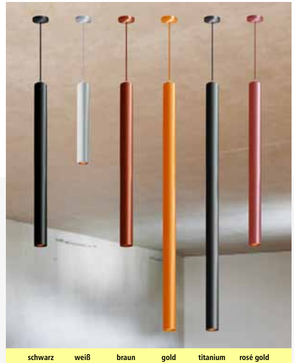
schwarz weiß braun gold titanium rosé gold